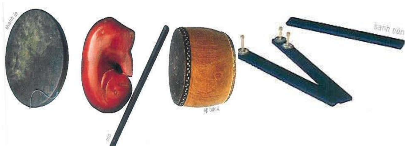
Hình ảnh 4 loại nhạc cụ

hát kể về âm thanh của 4 loại nhạc cụ. Sênh tiền, thanh la, mõ, trống. Lúc này tôi đưa ra cho học sinh xem 4 loại nhạc cụ đó đồng thời dùng âm thanh trên đàn miêu tả tiếng của từng loại nhạc cụ.